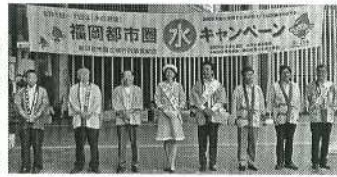
福岡県では、8月1日の「水の日」、8月1日から7日の「水の週間」に合わせ「福岡都市圏水キャンペーン」を実施した。...